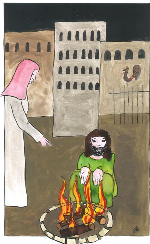
Velký pátek cyklu C Jan 18,1 – 19,42, zde Jan 18,15-18.25b-27