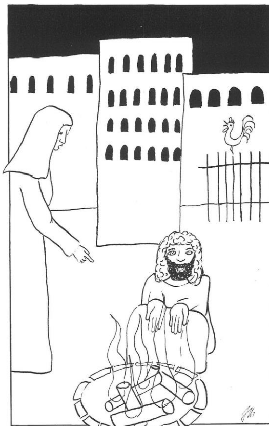
Velký pátek cyklu C Jan 18,1 – 19,42, zde Jan 18,15-18.25b-27