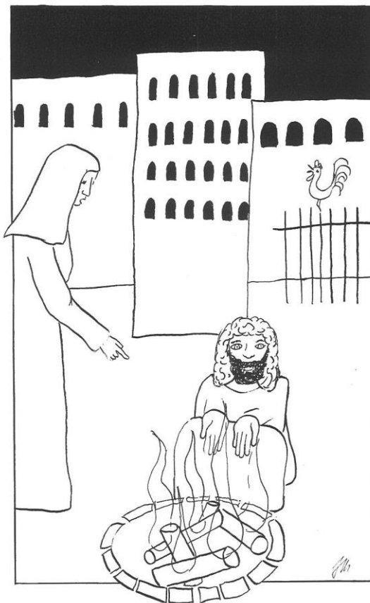
Velký pátek cyklu C Jan 18,1 – 19,42, zde Jan 18,15-18.25b-27