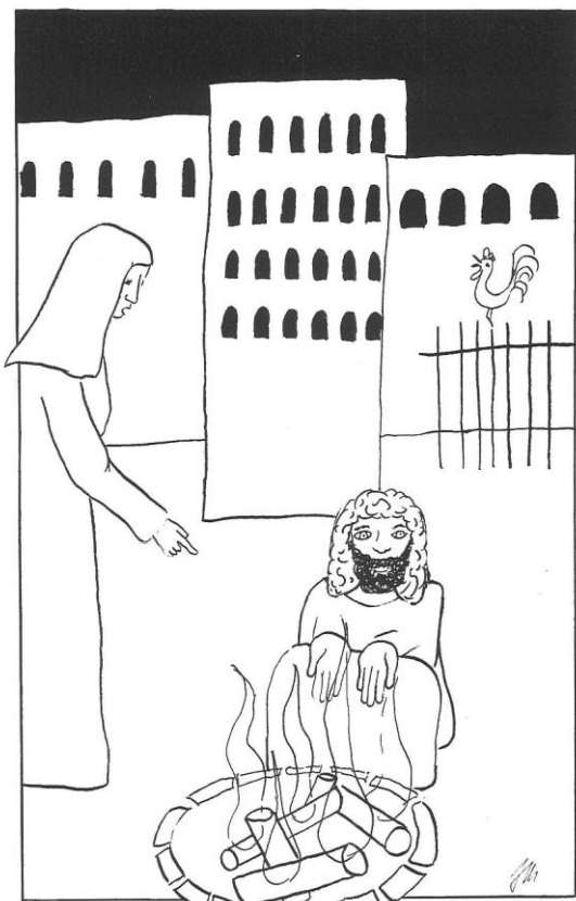
Velký pátek cyklu C Jan 18,1 – 19,42, zde Jan 18,15-18.25b-27